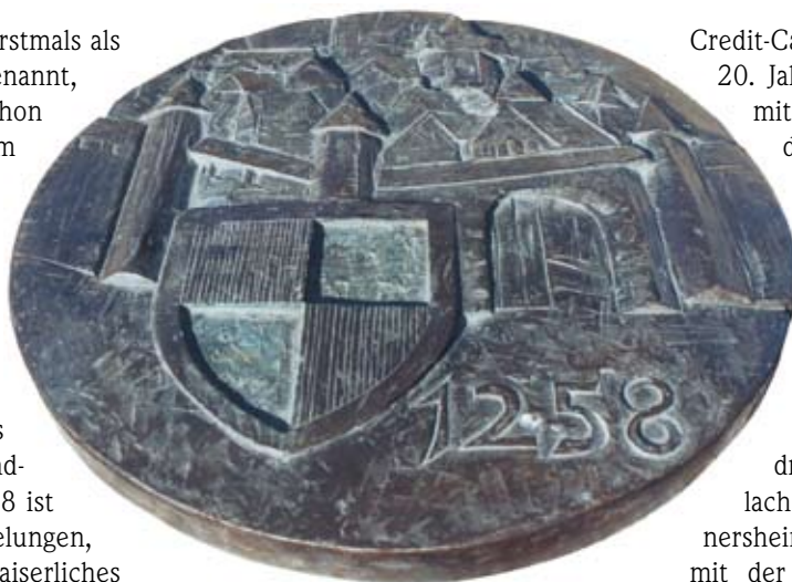
Bronze-Medaillon (1998) von Norbert Kleinlein am Oberen Markt in Volkach

Doch es gelang den Castellern nicht, ihren Besitz in und um Volkach so zu stabilisieren, dass er auf Dauer gehalten werden konnte. Durch mehrere Verpfändungen in der ersten Hälfte des 14. Jahrhunderts gelangte die Hälfte der Stadt Volkach an das Hochstift Würzburg und es ist damals wohl das Stadtwappen entstanden, wie man es heute noch am Emporenpfeiler in Maria im Weingarten sehen kann, links der fränkische Rechen, rechts der Rot-Silber gevierte Schild der Grafen zu Castell.