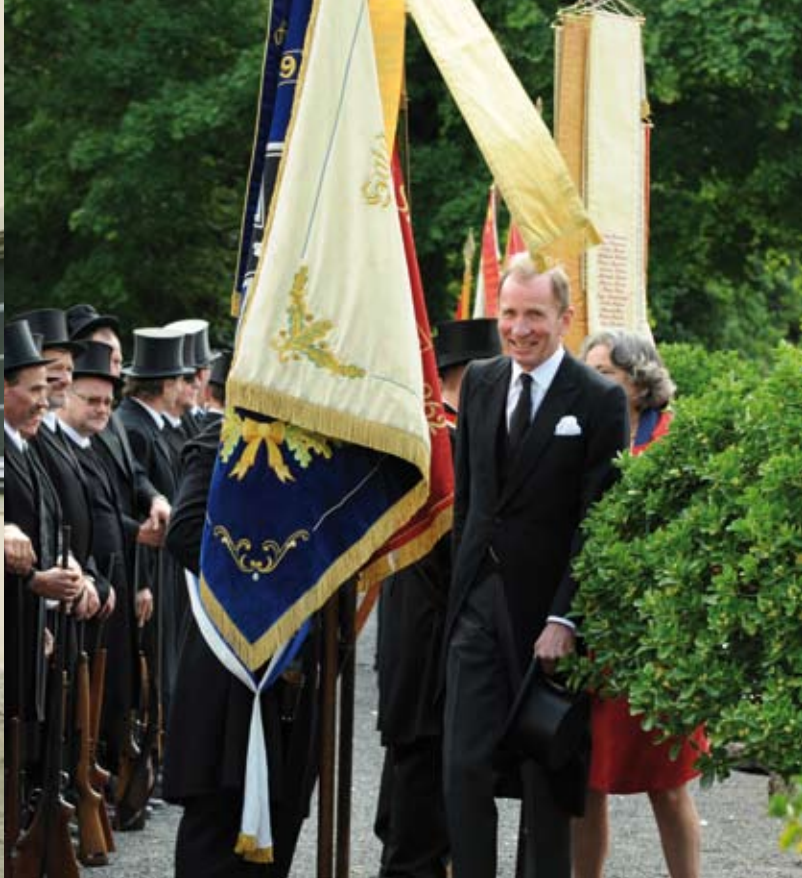
Höhepunkt im Jahresverlauf ist der Bürgerauszug. Im Schlosshof begrüßt das Fürstenpaar die in Gehrock und Zylinder gekleidete Rüdnhäuser Bürgerwehr.

Vorträge oder andere Veranstaltungen organisiert, dann laden wir auch gerne Freunde dazu ein, die sich für das Thema interessieren. Dass sich daraus weitergehende Kontakte zu Mitarbeitern unserer Unternehmen und gegebenenfalls gemeinsame Geschäftsbeziehungen ergeben können, ist sicher für alle Seiten gut.