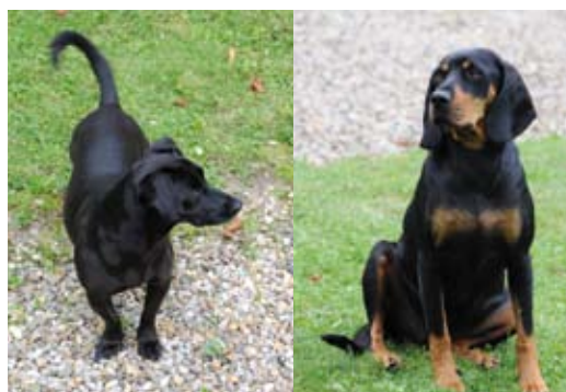
Immer mit dabei: Mischlingshündin Breta (links) und Brandlbracke Belli

Entsprechend Ihren Familienstatuten wird das Stammvermögen jeweils nur an den ältesten Sohn weitergegeben, während die anderen Kinder mit dem Pflichtteil abgefunden werden. Das erscheint für den Außenstehenden ungerecht.