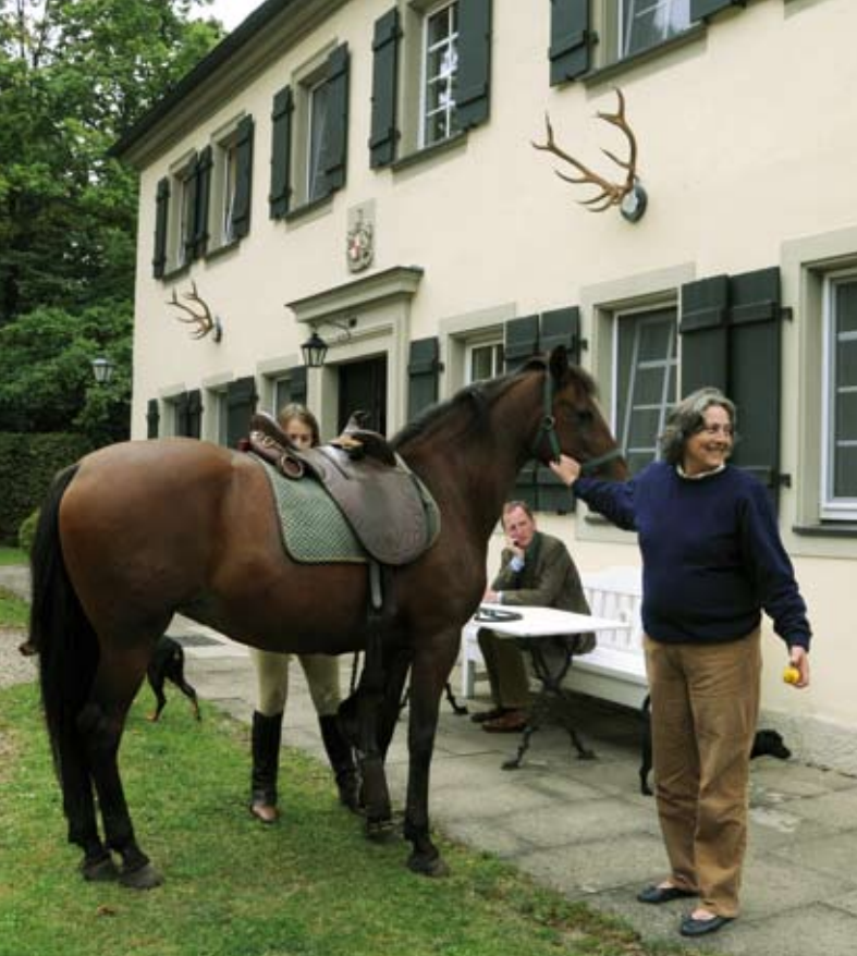
Die Lusitano-Pferde der Familie stammen aus der Zucht von Fürstin Marias Schwester in Portugal.